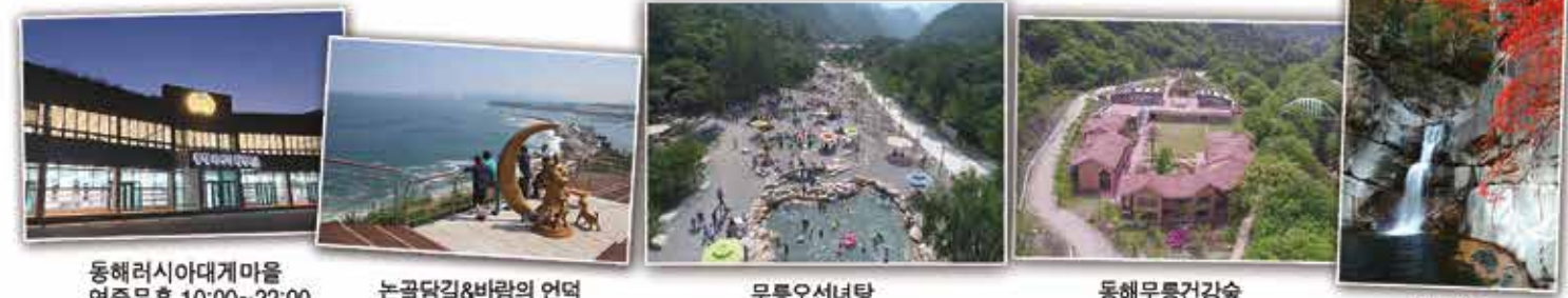
동해러시아대게마을 연중무휴 10:00~22:00