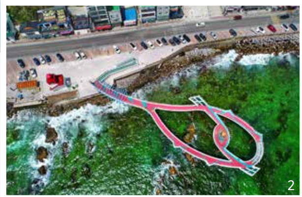
1 도재비골 스카이밸리 2 해랑전망대 전경