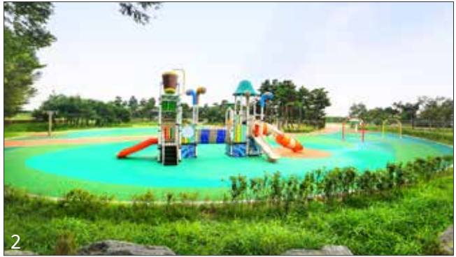
1, 2, 3 소풍정원

소풍정원은 평택시 고덕면 궁리에 4개 섬으로 조성한 9천249㎡ 규모의 습지 공원이다. 이 공원에서는 자연과 사람이 함께 어우러진 상태를 체험할 수 있다.