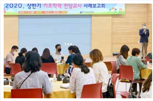
기초학력 전담교사제 운영 사례보고회