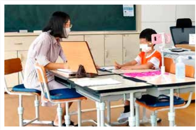
기초학력 전담교사제 수업 모습

전라남도교육청(교육감 장석웅)이 올해 기초학력 부진 조기 예방을 위해 전국에서 처음으로 도입한 기초학력 전담교사제가 현장의 호응을 받으며 성과를 내고 있다.