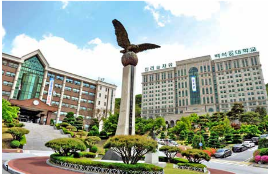
1 백석문화대 전경 2 제과제빵 전공 3 백석다빈치아카데미 신성우 교수